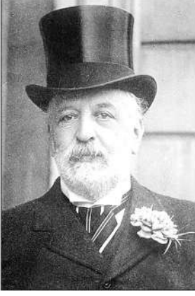
ಲಾರ್ಡ್ ರಾತ್ಸ್ ಚೈಲ್ಡ್

ಸಂಕಲ್ಪವನ್ನು ಪ್ರಕಟಿಸಲಾಯಿತು. ಇಲ್ಲಿ ಬಹಳ ಗಮನಾರ್ಹವಾದ ಒಂದು ಅಂಶವೇನೆಂದರೆ 'ಬಾಲ್ ಫೋರ್ ಪ್ರಕಟಣೆ' ಎಂಬುದು ಒಂದು ಒಪ್ಪಂದ ಅಥವಾ ಗೊತ್ತುವಳಿಯ ರೂಪದಲ್ಲಿರಲಿಲ್ಲ. ಅದು ಬ್ರಿಟನ್ ಸಾಮ್ರಾಜ್ಯದ ವಿದೇಶ ಕಾರ್ಯದರ್ಶಿ ಆರ್ಥರ್ ಬಾಲ್ ಫೋರ್ (Arthur Balfour) ಅವರು, ಬ್ರಿಟನ್ ನ ಯಹೂದಿ ಸಮುದಾಯದ ಪ್ರಭಾವಿ, ಶ್ರೀಮಂತ ನಾಯಕ ಹಾಗೂ ರಿಯೋನಿಸ್ಟ್ ಆಂದೋಲನದ ಪ್ರತಿನಿಧಿ ಲಾರ್ಡ್ ರಾತ್ಸ್ ಚೈಲ್ಡ್ (Lord Rothschild) ಅವರಿಗೆ