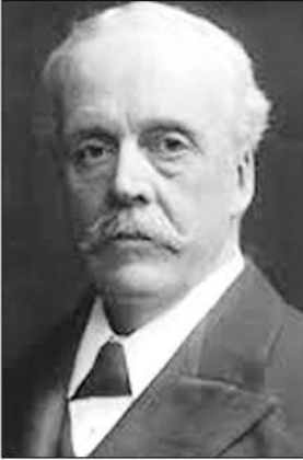
ಆರ್ಥರ್ ಬಾಲ್ ಫೋರ್

ಅಧಿಕೃತ ಹೆಜ್ಜೆ ಇಟ್ಟದ್ದು ಬ್ರಿಟಿಷ್ ಸರ್ಕಾರ. ಪ್ರಥಮ ಜಾಗತಿಕ ಯುದ್ಧದ ನಡುವೆ 1917ರಲ್ಲಿ ಬಲಿಷ್ಠ ವಸಾಹತುಶಾಹಿ ಬ್ರಿಟಿಷ್ ಸಾಮ್ರಾಜ್ಯವು ಉಸ್ಮಾನಿಯಾ (Ottoman) ಸಾಮ್ರಾಟರನ್ನು ಸೋಲಿಸಿ ಫೆಲೆಸ್ಟೀನ್ ಅನ್ನು ಅವರಿಂದ ಕಿತ್ತುಕೊಂಡಿತು. ಆ ವರ್ಷ ನವೆಂಬರ್ 2ರಂದು ಫೋರ್ ಬಾಲ್ 'ಬಾಲ್ ಫೋರ್ ಪ್ರಕಟಣೆ'ಯಲ್ಲಿ ಫೆಲೆಸ್ಟೀನ್‌ನಲ್ಲಿ ಯಹೂದಿ ಜನಾಂಗಕ್ಕಾಗಿ ಒಂದು ರಾಷ್ಟ್ರವನ್ನು ಸ್ಥಾಪಿಸುವ