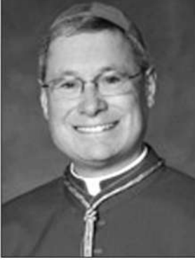
ಬಿಷಪ್ ಡೇವಿಡ್ ಜೆ. ಮೆಲ್ಲೋಯ್

ಕಳೆದ ವರ್ಷ ಇಸ್ರೇಲ್ ಮತ್ತು ಸಂಯುಕ್ತ ಅರಬ್ ಎಮಿರೇಟ್ಸ್ (ಯುಎಇ) ನಡುವೆ ಒಂದು ಶಾಂತಿ ಒಪ್ಪಂದ ನಡೆಯಿತು. ಇಸ್ರೇಲ್ ಸರಕಾರ ಅಸ್ತಿತ್ವಕ್ಕೆ ಬಂದ ಬಳಿಕ ಅದರ ಜೊತೆ ಅಧಿಕೃತವಾಗಿ ಪೂರ್ಣ ಪ್ರಮಾಣದ ರಾಜತಾಂತ್ರಿಕ ಸಂಬಂಧ ಸ್ಥಾಪಿಸಿಕೊಂಡ ಮೊದಲ ಅರಬ್ ದೇಶ ಈಜಿಪ್ಟ್ ಆಗಿತ್ತು. ಈ ಬೆಳವಣಿಗೆ 1979ರಲ್ಲಿ ನಡೆದಿತ್ತು. ಆ ಬಳಿಕ 1994ರಲ್ಲಿ ಜೋರ್ಡನ್ ಈ ಸಾಲಿಗೆ ಸೇರಿತು. 2020ರಲ್ಲಿ ಯುಎಇ ಅಂತಹ ಮೂರನೆಯ ಅರಬ್ ದೇಶವಾಯಿತು.