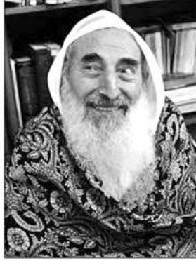
ಶೇಖ್ ಅಹ್ಮದ್ ಯಾಸೀನ್

ಇಂದು ಫೆಲೆಸ್ಟೀನ್‌ನಲ್ಲಿ ಪ್ರಬಲವಾಗಿರುವ ಹಮಾಸ್ ಪಕ್ಷದ ಸ್ಥಾಪಕ, ಶೇಖ್ ಅಹ್ಮದ್ ಯಾಸೀನ್ 1936 ರಲ್ಲಿ ಅಲ್ ಜೂರಾ ಎಂಬ ಫೆಲೆಸ್ಟೀನ್‌ನ ಒಂದು ಸುಂದರ ಗ್ರಾಮದಲ್ಲಿ ಜನಿಸಿದರು. ಸುಮಾರು 500 ಮನೆಗಳಿದ್ದ ಆ ಗ್ರಾಮ