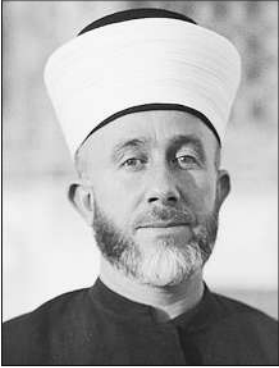
ಮುಘ್ಠಿ ಅಮೀನ್ ಅಲ್ ಹುಸೈನಿ

ಯೂರೋಪಿನ ಯಹೂದಿಗಳು ಫೆಲೆಸ್ಟೀನ್ ನಾಡಿಗೆ ವಲಸೆ ಹೋಗುವ ಪ್ರಕ್ರಿಯೆ 20ನೇ ಶತಮಾನದ ಆರಂಭದಲ್ಲಿ ತುಂಬಾ ವ್ಯಾಪಕವಾಗಿ ಬಿಟ್ಟಿತು. ಯೂರೋಪಿನಲ್ಲಿ ಕ್ರೈಸ್ತ ಮತ್ತು ಬಿಳಿಯ ಜನಾಂಗವಾದಿಗಳ ಕೈಯಲ್ಲಿ ಲಕ್ಷಾಂತರ ಯಹೂದಿಗಳ ಸಾಮೂಹಿಕ ಹತ್ಯಾಕಾಂಡಗಳು ನಡೆಯಲಾರಂಭಿಸಿದ ಬಳಿಕ ಅಂದರೆ ನಲ್ವತ್ತರ ದಶಕದಲ್ಲಿ ಈ ಪ್ರಕ್ರಿಯೆ ಮಹಾವಲಸೆಯ ರೂಪ ತಾಳಿಕೊಂಡಿತು. ಅತ್ತ ಅರಬ್ ಜನತೆಯಲ್ಲಿ ಈ ಪ್ರಕ್ರಿಯೆಯ ವಿರುದ್ಧ ಇದ್ದ ಅಸಮಾಧಾನವು ಧಾರ್ಮಿಕ ಹಾಗೂ ರಾಷ್ಟ್ರೀಯವಾದಿ ಆಯಾಮಗಳನ್ನು ಪಡೆದುಕೊಂಡು ಕುದಿಯತೊಡಗಿತು. ಅಲ್ಲಲ್ಲಿ ವಲಸಿಗರ ಮತ್ತು ಅವರ ರಕ್ಷಣೆಗೆ ಬದ್ಧರಾಗಿದ್ದ ಬ್ರಿಟಿಷ್ ವಸಾಹತುಶಾಹಿಗಳ ವಿರುದ್ಧ ಪ್ರತಿಭಟನೆಗಳು ಆರಂಭವಾದವು. 1935ರಲ್ಲಿ ಬ್ರಿಟನ್ ಏಜಂಟರು ಬ್ರಿಟಿಷ್ ವಿರೋಧಿ ಅರಬ್ ನಾಯಕ ಇರ್ಫಾಉದ್ದೀನ್ ಅಲ್ ಖಿಸ್ತಾಮ್‌ರ ಹತ್ಯೆ ನಡೆಸಿದರು. ಅದರ ಬೆನ್ನಿಗೆ, ಫೆಲೆಸ್ಟೀನ್