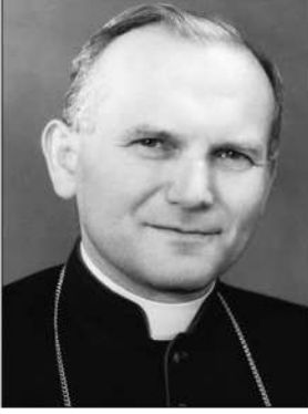
ಪೋಪ್ ಜಾನ್ ಪಾಲ್ (ದ್ವಿತೀಯ)

ಪಯಸ್ - 12 ಅವರು ತಾಳಿದ್ದ ನಿಲುವಿನ ಬಗ್ಗೆ ಯಹೂದಿಗಳಿಗೆ ತೀವ್ರ ಆಕ್ರೇಪವಿತ್ತು. ಈ ಕುರಿತು ಯಹೂದಿಗಳು ಮತ್ತು ಕೆಥೋಲಿಕರ ನಡುವೆ ವಿವಿಧ ವೇದಿಕೆಗಳಲ್ಲಿ ಮತ್ತು ಪರಸ್ಪರ ಅಧಿಕೃತ ಮಾತುಕತೆಗಳ ವೇಳೆ ಹಲವು ಬಾರಿ ಬಹಳ ಬಿಸಿ ಬಿಸಿಯಾದ ವಿನಿಮಯಗಳೂ ನಡೆದಿದ್ದವು. ಕೆಥೋಲಿಕ್ ಚರ್ಚು ಹೋಲೋಕಾಸ್ಟ್ ಸಂದರ್ಭದಲ್ಲಿ ತಾನು ತಳೆದ ನಿಲುವಿಗೆ ವಿವಿಧ ಬಗೆಯ ಸಮರ್ಥನೆಗಳನ್ನು ಮುಂದಿಡುತ್ತಲೂ ಬಂದಿತ್ತು.