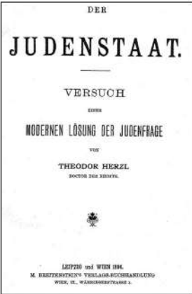
'ಡೆರ್ ಜೂಡೆನ್ ಸ್ಟಾಟ್'

ಆತ್ಮವಿಶ್ವಾಸ ಮತ್ತು ಹೊಸ ಚೈತನ್ಯವನ್ನು ಬೆಳೆಸಬೇಕೆಂಬುದು ಅದರ ಘೋಷಿತ ಧ್ಯೇಯವಾಗಿತ್ತು. ಅದರ ಭಾಗವಾಗಿ ಯಹೂದಿ ಇತಿಹಾಸದ ವೈಭವವನ್ನು ನೆನಪಿಸುವ, ಹಿಬ್ರೂ ಭಾಷೆ ಮತ್ತು ಸಾಹಿತ್ಯಕ್ಕೆ ಪುನಶ್ಚೇತನ ನೀಡುವ ಹಾಗೂ ಕಲೆ, ಸಾಹಿತ್ಯ, ಶಿಕ್ಷಣ, ಕೃಷಿ, ವ್ಯವಸಾಯ, ಕಾರ್ಮಿಕ ರಂಗ ಇತ್ಯಾದಿ ವಿಭಿನ್ನ ಕ್ಷೇತ್ರಗಳಲ್ಲಿ ಯಹೂದಿಗಳನ್ನು ಸಂಘಟಿಸಿ ಸಕ್ರಿಯಗೊಳಿಸುವ ಚಟುವಟಿಕೆಗಳು ಆರಂಭವಾದವು. ಜೊತೆಗೆ