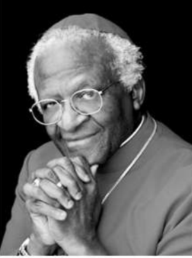
ಆರ್ಚ್ ಬಿಷಪ್ ದೆಸ್ಮನ್ಡ್ ಟೂಟು

ಸಂಘಟನೆಯ ನಿರ್ದೇಶಕ ಕೆನ್ನೆತ್ ರಾಥ್ ಹೇಳುತ್ತಾರೆ: ಕಳೆದ ಅರ್ಧ ಶತಮಾನದಿಂದ ಫೆಲೆಸ್ಟೀನ್ ಪ್ರದೇಶಗಳನ್ನು ಇಸ್ರೇಲ್ ತನ್ನ ಅಕ್ರಮ ವಶದಲ್ಲಿಟ್ಟುಕೊಂಡಿದ್ದು, ಜಗತ್ತಿನ ಹೆಚ್ಚಿನ ಜನರು ಇದು ಒಂದು ತಾತ್ಕಾಲಿಕ ಪ್ರಕ್ರಿಯೆ ಎಂದು ಮತ್ತು ಹಲವು ದಶಕಗಳಿಂದ ನಡೆಯುತ್ತಿರುವ ಶಾಂತಿ ಪ್ರಕ್ರಿಯೆಯ ಫಲವಾಗಿ ಕ್ರಮೇಣ ಆಕ್ರಮಿತ ಪ್ರದೇಶಗಳನ್ನು ತೆರವುಗೊಳಿಸಲಾಗುವುದು ಎಂದು ನಂಬುತ್ತಾ ಬಂದಿದ್ದಾರೆ. ಆದರೆ ಇತ್ತ ಇಸ್ರೇಲ್ ಕಡೆಯಿಂದ ಫೆಲೆಸ್ಟೀನ್ ಜನತೆಯನ್ನು ದಮನಿಸುವ ಪ್ರಕ್ರಿಯೆಯು ಚರಮ ಸೀಮೆಯನ್ನು ತಲುಪಿದ್ದು ಶಾಶ್ವತ ಸ್ವರೂಪ ತಾಳಿದೆ. ಈ ಪ್ರಕ್ರಿಯೆಯು ಜನಾಂಗವಾದ ಮತ್ತು ದಮನ ನೀತಿ ಎಂಬ ಅಪರಾಧಗಳಿಗಿರುವ ಎಲ್ಲ ವ್ಯಾಖ್ಯಾನಗಳ ಅನುಸಾರವಾಗಿಯೇ ಇದೆ.