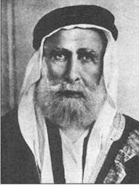
ಹುಸೈನ್ ಬಿನ್ ಅಲಿ

ಸೌದಿ ಅರೇಬಿಯಾ) ಇಂಗ್ಲೆಂಡ್ ಸರ್ಕಾರದ ಜೊತೆ ಒಂದು ಗುಪ್ತ ಒಪ್ಪಂದ ಮಾಡಿಕೊಂಡು ಬಾಲ್ ಫೋರ್ ಪ್ರಕಟನೆಗೆ ತನ್ನ ಅಧಿಕೃತ ಮನ್ನಣೆ ನೀಡಿತು ಎಂಬೊಂದು ಆರೋಪ ಈಗಲೂ ಹಲವೆಡೆ ಚಲಾವಣೆಯಲ್ಲಿದೆ. ನಿಜವಾಗಿ, ಅಂತಹ ಅಕ್ರಮ ಒಪ್ಪಂದವೊಂದು ಆ ವರ್ಷ ನಡೆದಿತ್ತು ಮತ್ತು ಅದು ಅರಬ್ ಸರ್ಕಾರವೊಂದು ಫೆಲೆಸ್ಟೀನ್‌ಗೆ ಮಾಡಿದ ಮೊದಲ ದೊಡ್ಡ ದ್ರೋಹವಾಗಿತ್ತು ಎಂಬುದು ನಿಜ. ಆದರೆ ಸೌದಿ ರಾಜಮನೆತನಕ್ಕೆ ಅಥವಾ ಇಂದಿನ