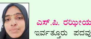
ಎಸ್.ಪಿ. ರಝೀಯ ಇರ್ವತ್ತೂರು ಪದವು