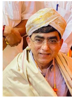
ರಾಜ್ಯೋತ್ಸವ ಪ್ರಶಸ್ತಿ ಕಿಟ್ಟಿಯಪ್ಪ

* ಅಬುಧಾಬಿರೊ ರೂಯದ್ ಚಾರಿಟಿಬಲ್ ಫೌಂಡೇಶನ್‌ಲ್ ಸೀನಿಯರ್ ಫೈನಾನ್ಸಿಯಲ್ ಕಂಟ್ರೋಲರ್ ಆಯಿಟ್ 18 ವರ್ಷ.