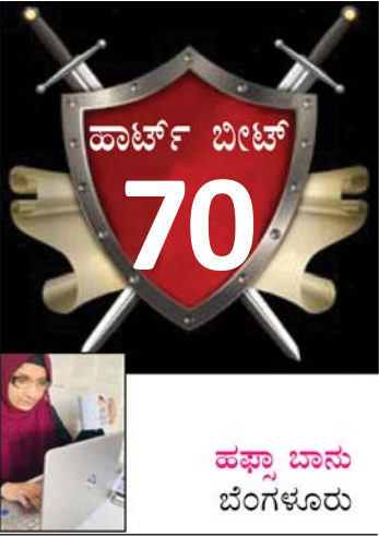
ಹೆಚ್ಚು ಬಾನು ಬೆಂಗಳೂರು